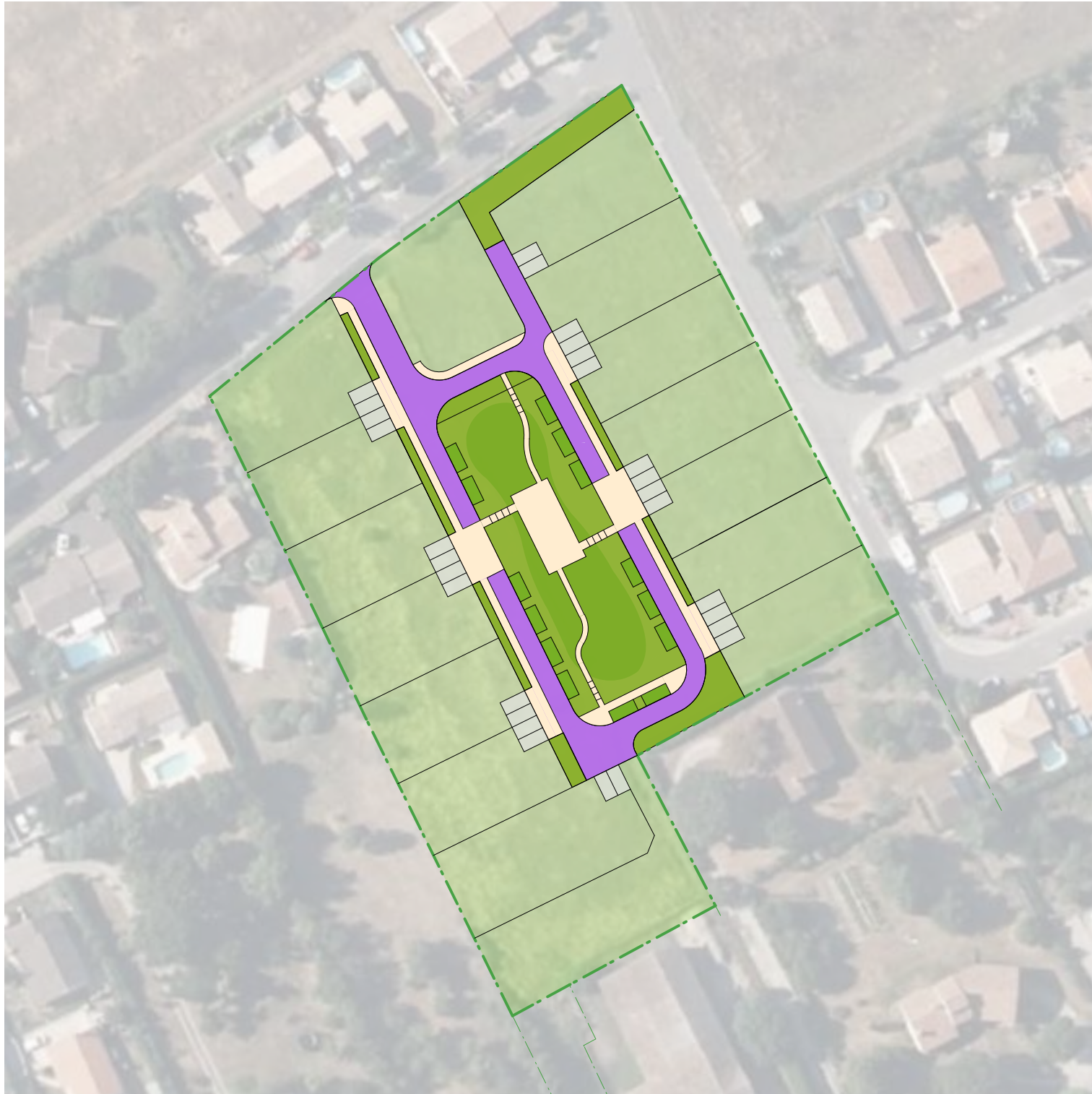
PLAN DE RÉPARTITION - Echelle 1/1000 ESPACES COLLECTIFS ESPACES PRIVÉS LOTS ESPACES VERTS COLLECTIFS