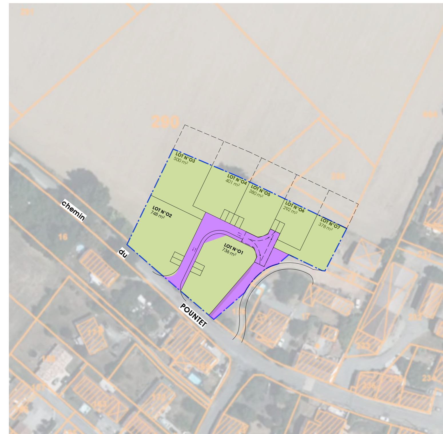
PLAN DE RÉPARTITION - Echelle 1/1000